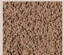
表面イメージ(荒砂仕上げ)

※印刷色と実物色は必ずしも一致しませんので、ご注意ください。 ※現場打ち床版や地覆などは状況に応じて、現場塗装が必要です。 ※壁面同士の目地部はコーキング材(ホワイト、グレー、アイボリーなど)が必要です。 特殊な壁面カラーを選定する場合は、コーキング材との色合わせにご注意ください。 ※完全受注製品のため納期にご注意ください。