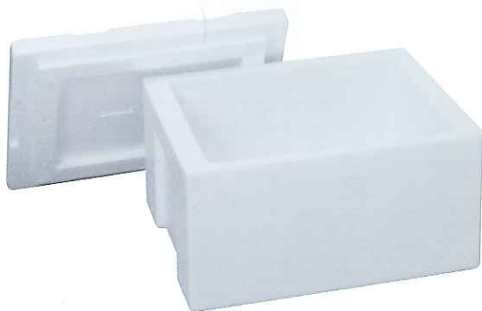
※白タイプは受注生産品

1 繰り返しの使用に適しています。 一般的な保冷ボックスに比べ、耐久性・耐衝撃性に優れ、強靱で、繰り返し使用に耐える強度を保持しています。