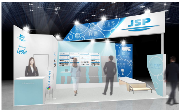
当社ブースイメージ